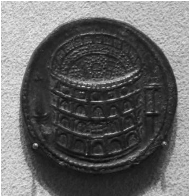
Sestertius, Altes Museum Berliini.