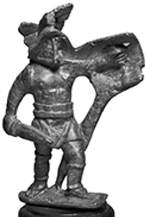
Gladiaattoria esittävä pronssiveistos, keisariaika, Bologna, Museo Civico Archaeologico, Inv. ROM 1096.

Varmuudella tiedetään, että ensim- mäinen kolmen gladiaattorin taistelu käytiin vuonna 261 eKr. edesmenneen Brutus Pe- ran kunniaksi. Gladiaattoritaistelujen histo- riassa vuonna 65 eKr. Julius Caesarille