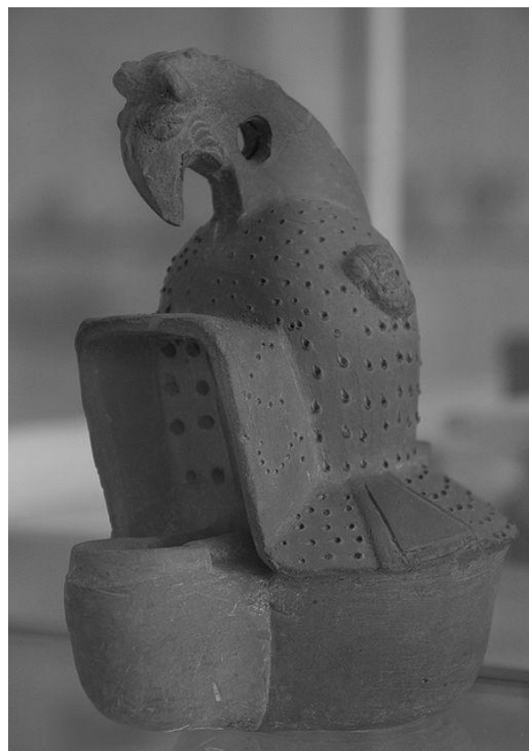
Gladiaattorin kypärää esittävä öljylamppu, Mu- seum het Valkhof (Hollanti).

Gladiaattorit kuolema ja voitto Colos- seumilla on moderni ja kompakti näyttely. Näyttelyarkkitehtuuri tukee esineistön esil- lepanoa keskittyen vain olennaiseen. Gladi- aattorit esitetään useasta näkökulmasta. Mi- nun jakamattoman huomioni varasti kui- tenkin Colosseum, joka yhä edelleen seisoo Roomassa paikallaan ja toimii nykyisin mitä erilaisimpien näytösten näyttämönä.