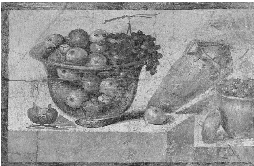
Pompeilainen seinämaalauk 63–79, Praedia Julia Felix, Napolin arkeologinen museo.